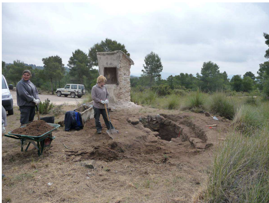
Foto 1. Aljibe del Tollo. Descubrimiento y limpieza de represa y vertiente. Fecha: 15.4.2010