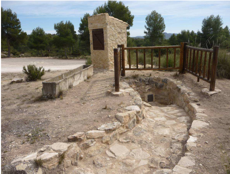
Foto 3. Aljibe del Tollo. Aljibe, represa y vertiente. Estado final.