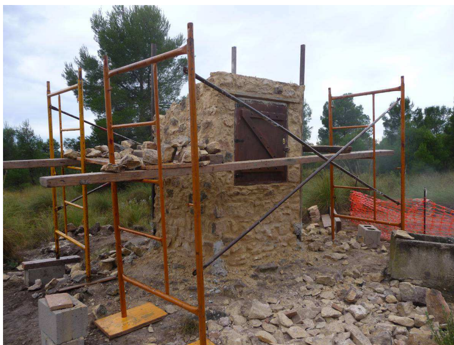
Foto 2. Aljibe del Tollo. Reconstrucción de la capilla del aljibe. Fecha: 22.12.2010