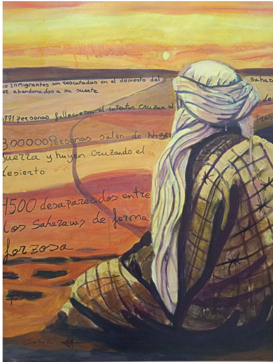
Sahara 100x81 cm. Acrílico