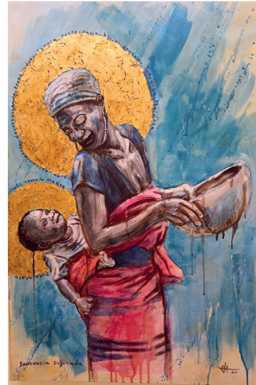
Inocencia Injuriada 90x60 cm. Acrílico