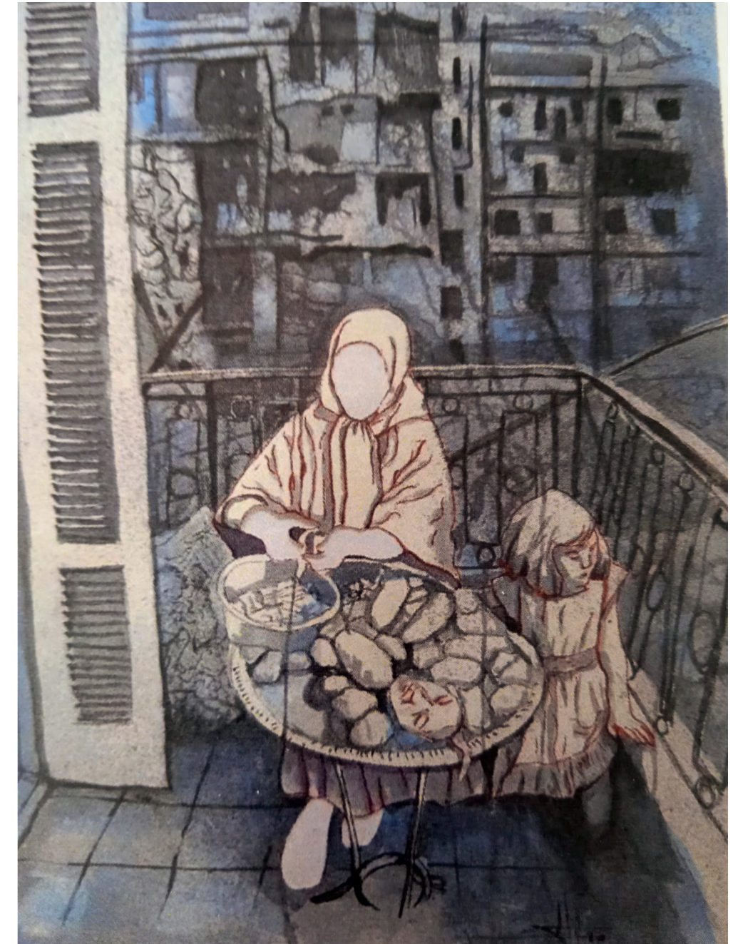
Esa guerra viene siempre con hambre 57x42 cm. Técnica mixta acuarela

Destinos inciertos. Tocando en cada puerto. Vagando sin hogar. Buscando la esperanza. Llamando en puertas sordas. Navegando en un mar de muertos, fantasmas tras de ti. Ausencia en los recuerdos. Billete de ida sin vida. Huyendo del horror. Dolor, miedo, frustración. Un mapa apátrida, fratricida de ilusión. Frontera de los sueños rotos. ¿Dónde quedó tu sonrisa? En la montaña de chalecos rojos. ¿Qué será de tu vida? En continua huida por la barbarie y la sinrazón. ¿Cuándo encontrarás tu casa? Hoy solo, en tu corazón.