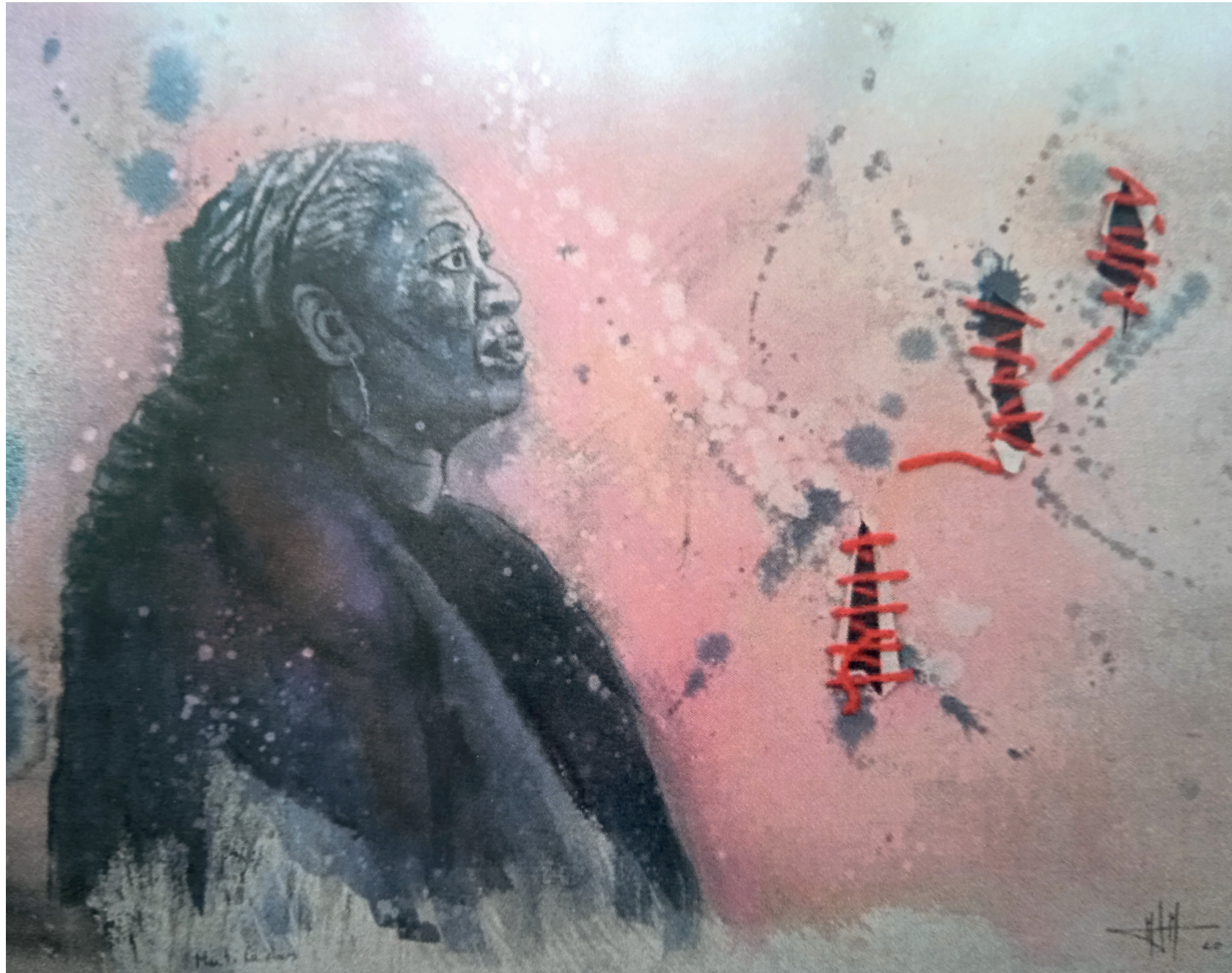
Mutiladas 59x70 cm. Técnica mixta de acuarela