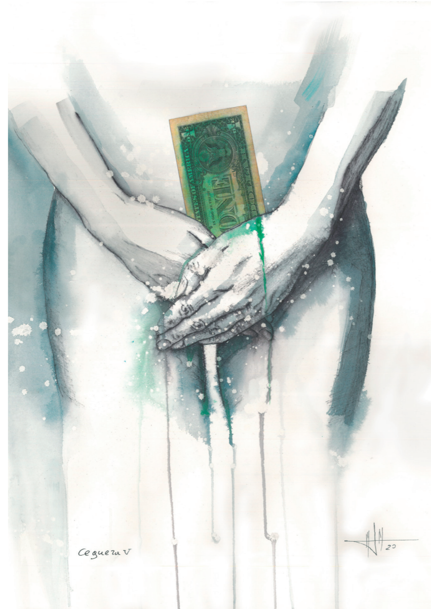
Ceguera V 51x36 cm. Técnica mixta acuarela

¡Esa guerra, siempre con hambre! ¡Ese permiso para el sinsentido! Un olvido con ceguera; una razón con odio; un odio con sordera. Esa avaricia que no para, ese miedo que no sabe de fronteras; esas fronteras que saben tanto de miedo. ¡Esa guerra, siempre con hambre! Ese hambre sin justicia; esa lágrima sin pañuelo; esa masa sin ojos, la locura sin sentido. ¡Esa guerra, siempre con hambre! Esa culpa de la carne, esa carne de la culpa; ese pecado sin nombre, dentro de todos los rostros. Esos rostros sin nombre ni pecado; esas gargantas secas que no escuchamos. La voz, sin aliento, de los corazones. Silencio de sueños rotos. Esas cadenas de sufrimiento, ese sufrimiento en cadena. ¡Esa guerra, siempre con hambre! ¡Ese permiso para el sin sentido!