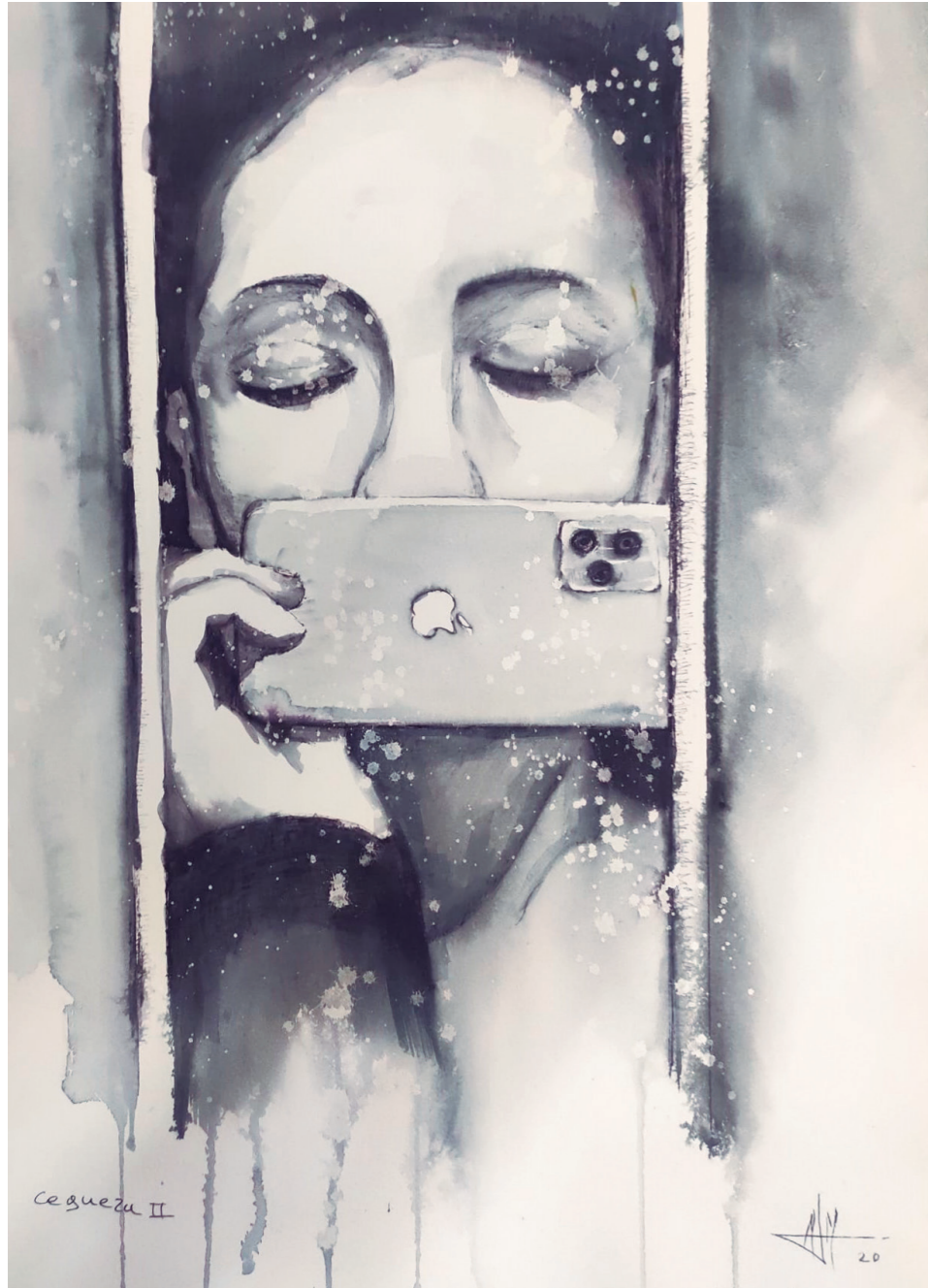
Ceguera II 51x36 cm. Técnica mixta acuarela