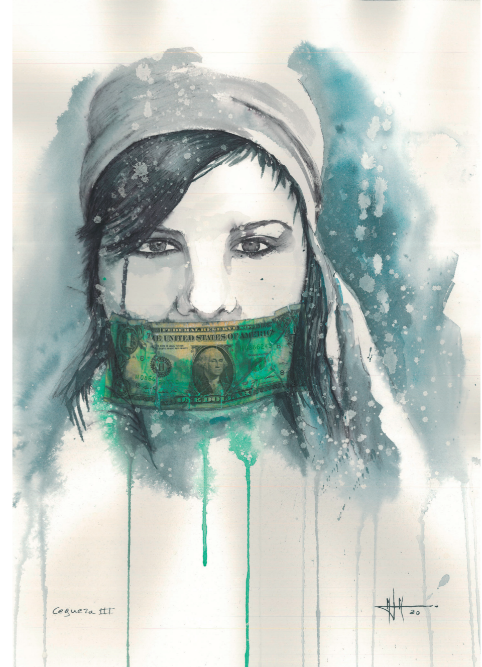
Ceguera III 51x36 cm. Técnica mixta

Que tu silencio mudo me llega al alma, hermana. Naces y te desechan, como si no valieras nada. Das la vida, y te juzgan igual que si no quieres darla. Sufres en silencio abusos, porque crees que no vas a ser escuchada. Tu cuerpo está a la venta, te despachan y te hacen esclava, y tu invisibilidad se escucha dentro de todas las almas. Te mutilan el clítoris, te violan, lapidan y matan. Vosotras, que sois las flores del mundo y vivís en las cloacas. Mujer, silencio del mundo, ¡Alza tú voz para que sea escuchada!