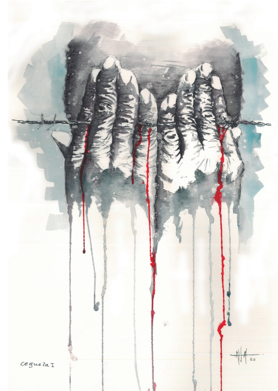
Ceguera I 51x36 cm. Técnica mixta acuarela