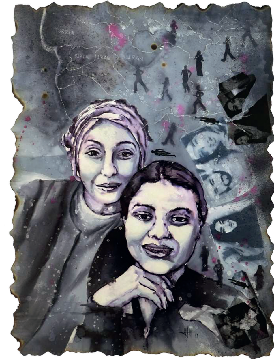
Destinos Inciertos II 75x55 cm Técnica mixta acuarela

Portada: Mirando hacia otro lado 100x81 Acrílico