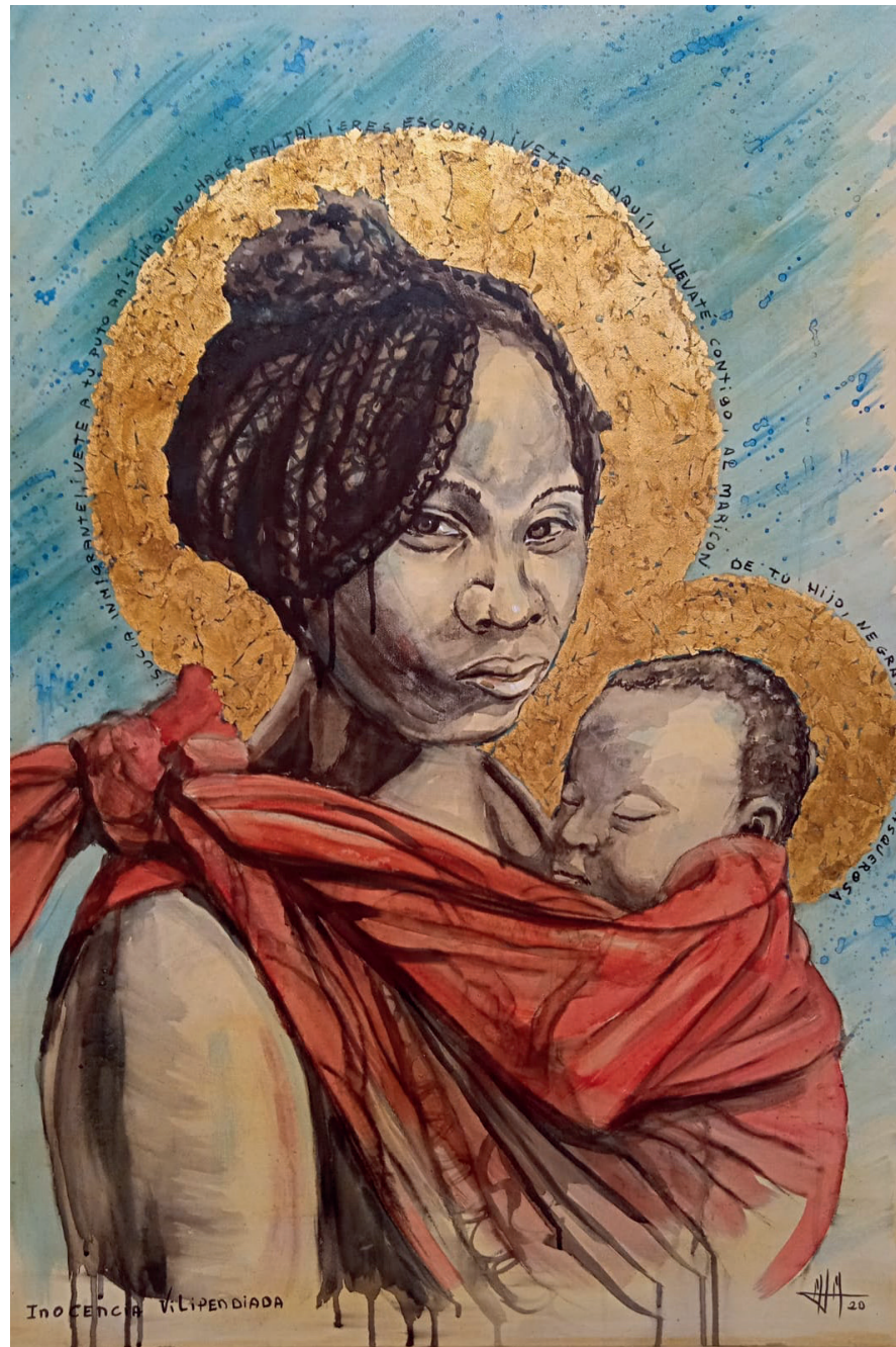
Inocencia Vilipendiada 90x60 cm. Acrílico