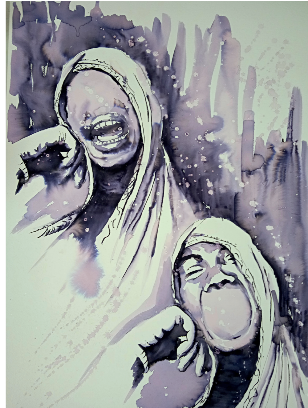
Sin aliento 76x55 cm. Técnica mixta acuarela