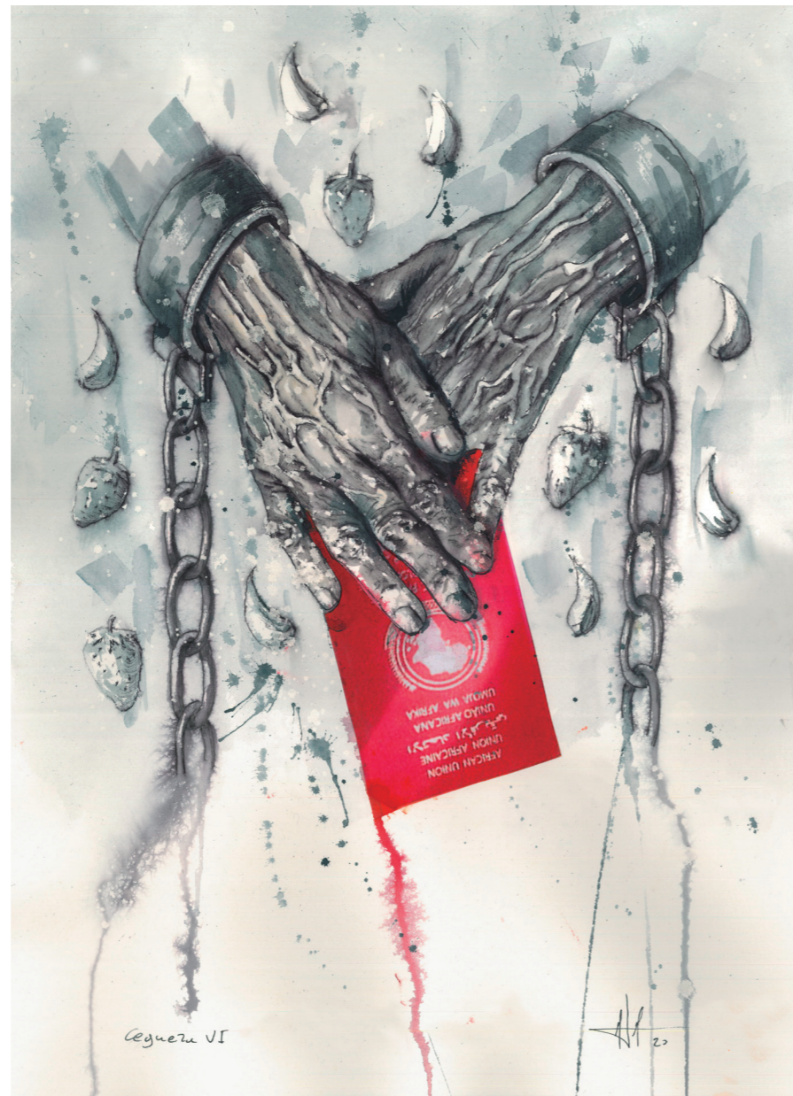
Ceguera VI 51x36 cm. Técnica mixta acuarela

¿Hacia dónde vuela mi mente, absorta y extraña? Verbo azul insondable. Hacia un mar de cenizas, de muertos sin pan. Olvidos y miserias. Sueños helados mirando al mar; cuna de civilizaciones; orilla deseada. Inalcanzable horizonte de tierra prometida. Nido de las sinrazones, donde se rompen los sueños, como rompen las olas en tus murallas y fronteras. Inmensidad, azul marino, celeste, ámbar, agua marina. En ti duermen, para siempre, miles de rostros anónimos. Aguada sangre oceánica que nos recorres las venas. Tus olas y su rumor hoy son la voz de los que se fueron para siempre.