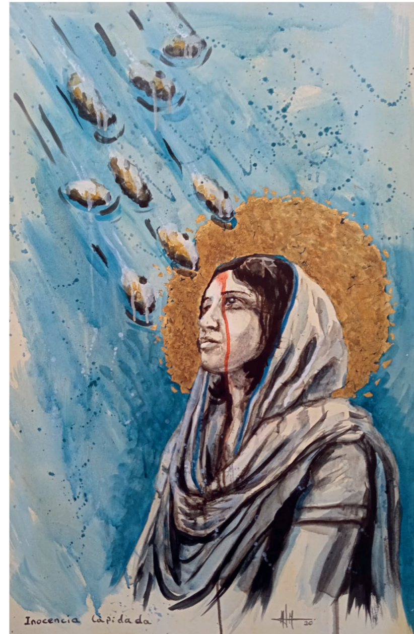
Inocencia lapidada 90x60 cm. Acrílico