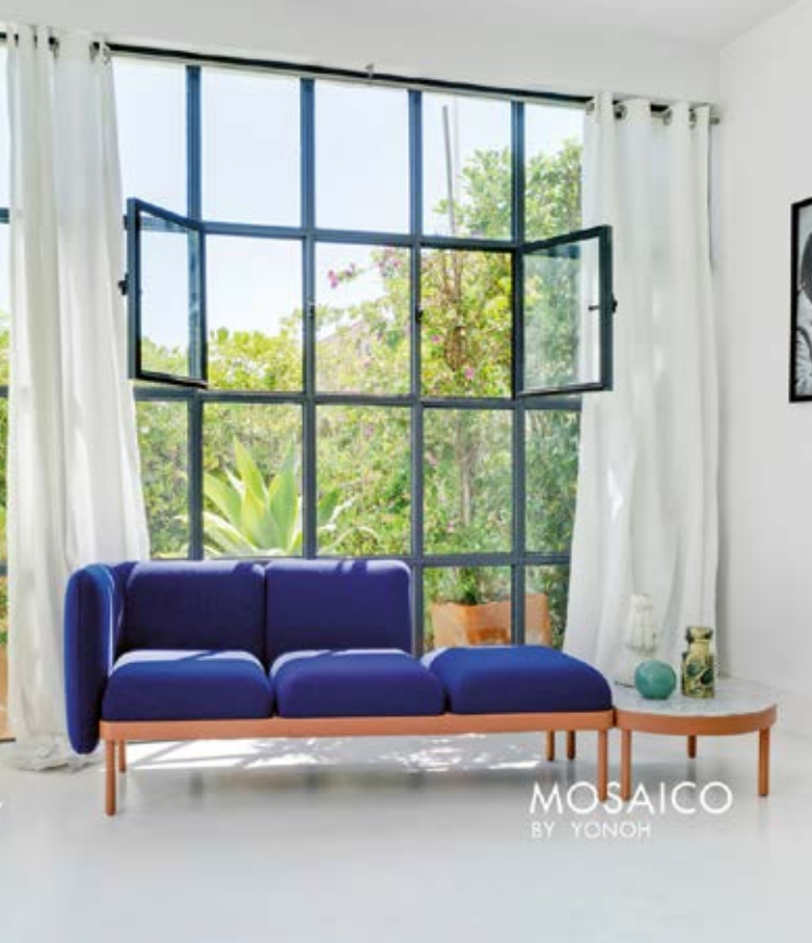
MOSAICO BY YONOH